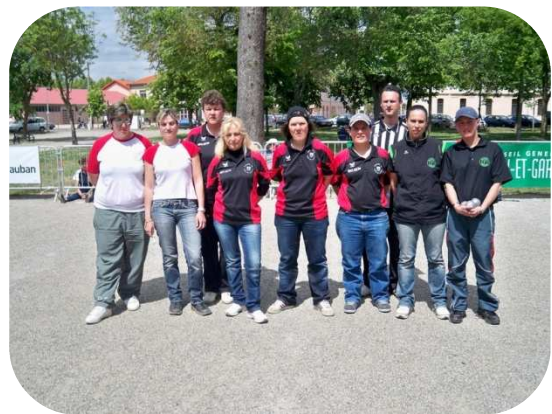
Les qualifiées pour la Ligue à Figeac